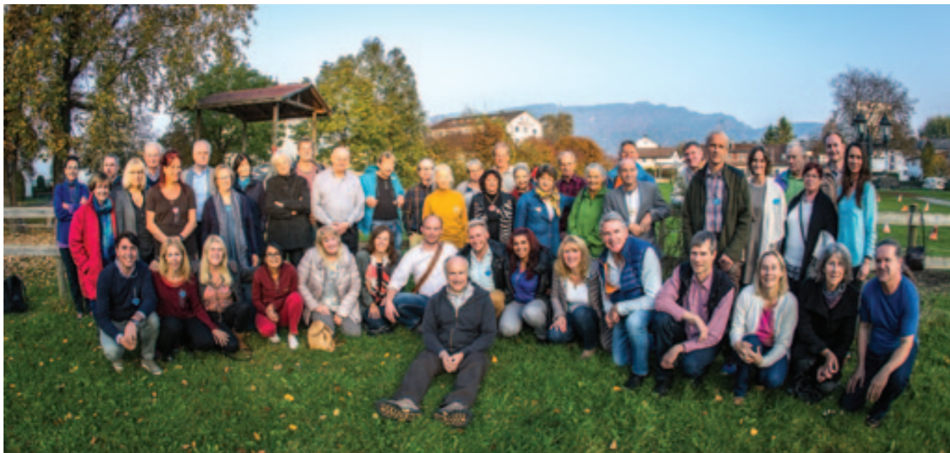
Teilnehmer des 35. Jahrestreffen der Seth-Freunde 2016

«Betrachtet jetzt erneut nur eure Ebene, die von diesen feinen Drähten eingegrenzt wird und meine Ebene auf der andern Seite. Wie ich gesagt habe, zeichnen sie sich auch durch grenzenlose Verbundenheit und Tiefe aus und unter gewöhnlichen Umständen ist die eine Seite auch für die andere transparent. Ihr könnt zwar nicht hindurchsehen, aber die beiden Ebenen durchdringen einander fortwährend.»