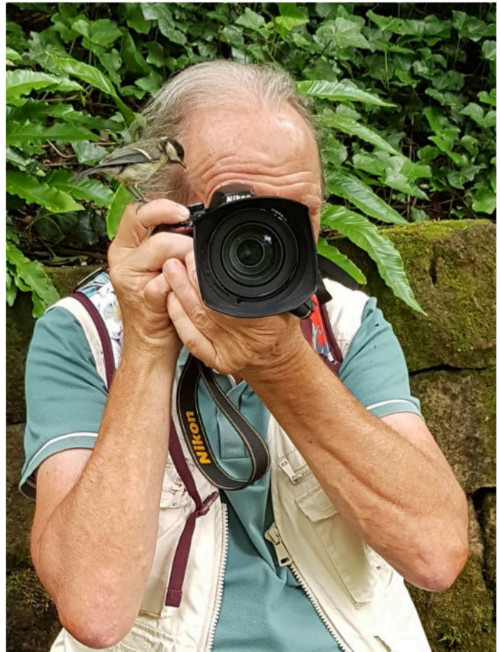
Eine Meise schaut dem Schreiber dieser Zeilen genau über die Finger

„Wie für jedes Tier, das neu an einem ihm unbekanntem Ort kommt, ist diese Scheune für ihn eine ganze Welt. Tomy muss sich diese jetzt erschliessen und bis in den letzten Winkel mit seiner Aufmerksamkeit erschliessen. ... Es ist für ihn wichtig, hier etwas zu finden, woran der Mensch nicht oft denkt ... eine Spur der Liebe.“